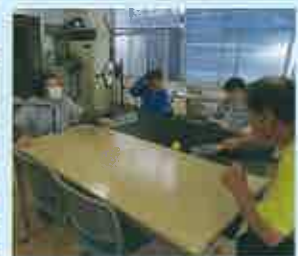
<テーブルホッケー>