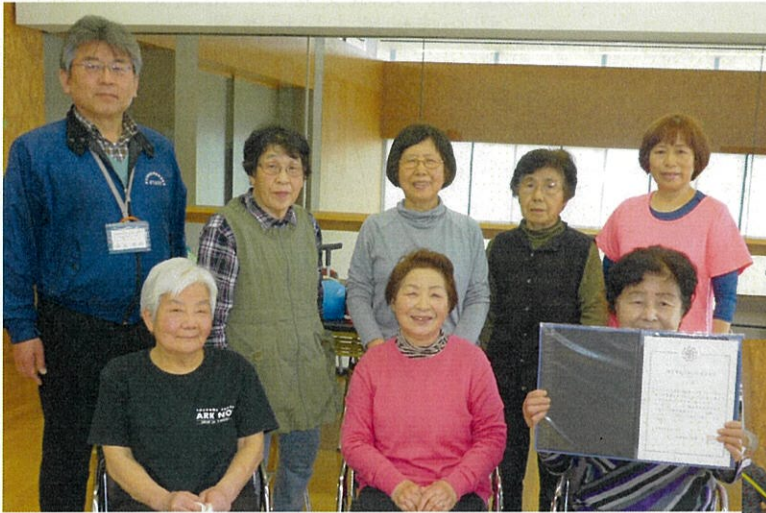
～舟山所長も交えて記念撮影～