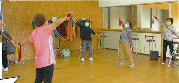
セラバンドを使った体操の様子