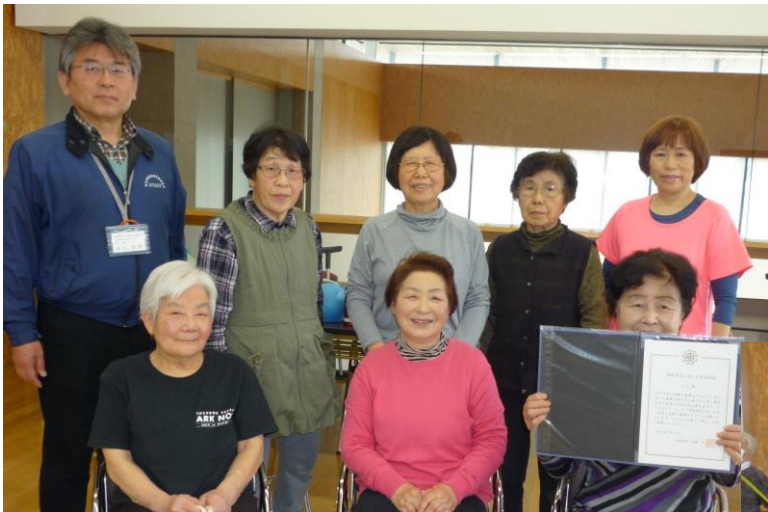
～舟山所長も交えて記念撮影～