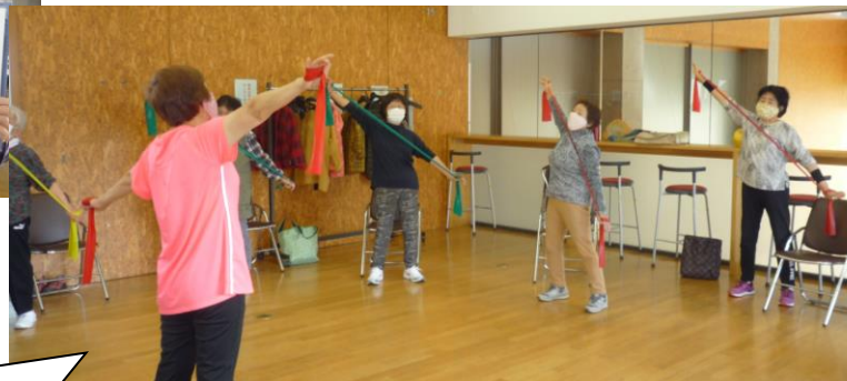
セラバンドを使った体操の様子